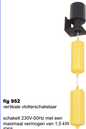
fig 952 vertikale vlotterafsluiter schakelt 230V-50Hz met een maximaal vermogen van 1,5 kW IP68 temp. : max +80°C