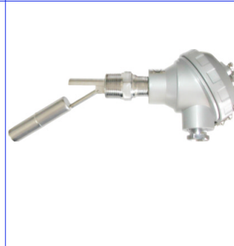
fig 881 inox vlotterafsluiter 1/2" - 3/4" bsp inox 316 huis en vlotter / aluminium kast temp. : -20°C +120°C max. druk 10 bar 1 kontakt max. 230V - 1,0 A