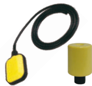
fig 950 horizontale vlotterafsluiter voorzien van 3 m kabel schakelt 230V-50Hz met een maximaal vermogen van 1,5 kW IP68 temp. : max +50°C