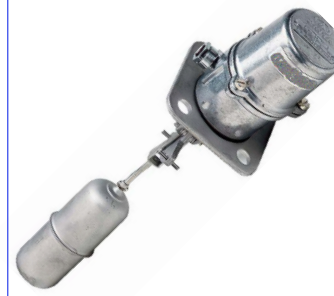
fig 871 (TC4) inox vlotterafsluiter magnetisch vlottercontact inox 316 huis en vlotter temp. : max. +150°C 1 omwisselbaar schakelcontact max. 250V - 1,5 A