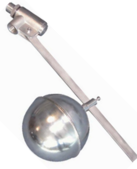
fig 962 inox vlotterafsluiter 3/4" bsp huis : inox 304 verschuifbare vlotterbol : inox 316 viton klepdichting temp. : -5°C/+90°C