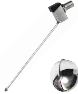
fig 963 inox vlotterafsluiter 3/8" - 4" bsp huis : inox 316 opschroefbare vlotterbol : inox 316 silicone klepdichting max. druk 10 bar temp. : -5°C/+150°C