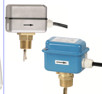
debietschakelaars 1" bsp messing aansluiting max. 10 bar / max. +110°C fig 895 : metalen kast IP54 fig 896 : aluminium kast IP64 schakelcontact 230V 10A