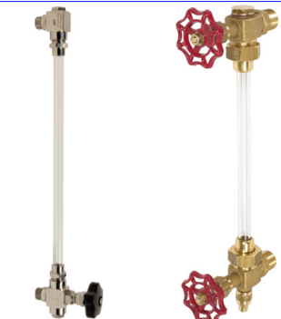
fig 891 inox niveauaanduiding (zonder glas) 3/8" - 1/2" - 1" bsp inox 316 naaldventiel en bocht max. druk 16 bar / temp. : -50°C +200°C viton en teflon afdichtingen fig 890 messing niveauaanduiding 1/4" - 3/8" - 1/2" - 3/4" bsp max. 6 bar/80°C