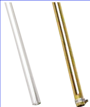
fig 892 plexiglas lengte 1 m diam. 10 - 13 - 16 - 18 - 20 mm fig 893 pyrex glas lengte 1,5 m diam. 10 - 13 - 14 - 16 - 18 - 20 mm fig 894 messing beschermhuis U lengte 1 m diam. 10 - 13 - 16 - 18 - 20 mm temp. : max +80°C