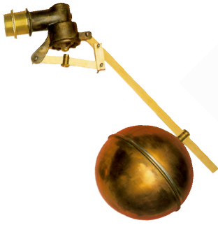
fig 960 messing vlotterafsluiter 1/2" - 2" bsp huis : messing verschuifbare vlotterbol : koper zitting : 1/2" - 5/4" messing zitting : 6/4" - 2" inox temp. : -5°C/+80°C