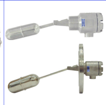
fig 882 inox vlotterafsluiter 1 1/2" bsp inox 316 huis en vlotter diam. 40 mm temp. : -20°C +150°C / max. druk 30 bar aluminium kast 1 kontakt max. 230V - 3,0 A fig 883 idem met flens PN10/16 DN40-DN100