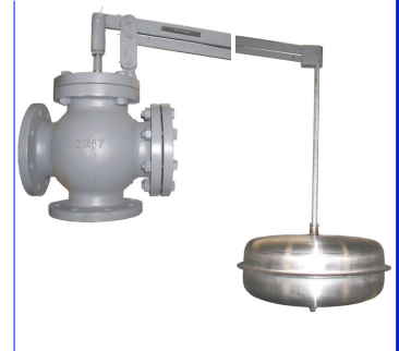
geflensde vlotterafsluiter pn16 rechte of haakse uitvoering dn50 - dn400 vlotterbol : inox 304 fig 966 : huis in gietijzer PN16 fig 967 : huis in staal PN16 fig 968 : huis in inox 316 PN16