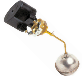
fig 872 (RL2100) vlotterafsluiter 1" bsp huis : messing vlotter diam. 70 mm in inox temp. : max. +125°C 2 schakelcontacten max. 250V - 1,5 A