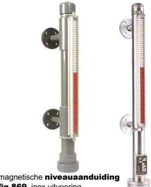
magnetische niveauaanduiding fig 869 inox uitvoering flenzen dn20 / lengte 800 - 1000 - 1200 mm fig 869PVC PVC uitvoering flenzen dn20 lengte 800 - 900 - 1000 - 1200 - 1400 mm